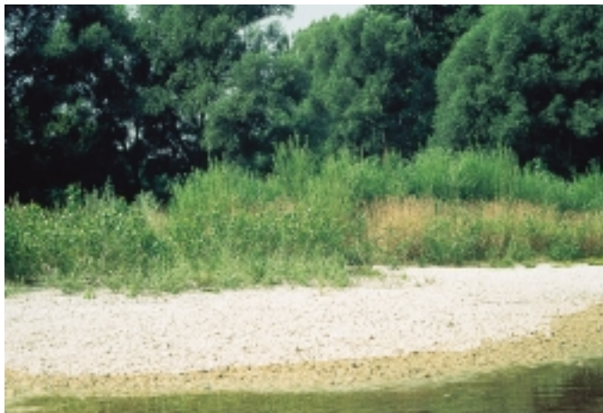
Am Rand eines Flussbetts haben sich auf einer Schotterbank junge Weiden und Pappeln angesiedelt. Ihre Überlebensaussichten sind nicht allzu groß, da ein starkes Hochwasser sie wieder mit sich reißen kann.

In den etwas flußferneren Teilen einer Aue bestimmt neben der Höhe der Mittelwasserlinie vor allem die Überflutungsdauer welche Pflanzen bzw. Pflanzengesellschaften dort anzutreffen sind. Die ökologische Bandbreite der Pflanzengesellschaften reicht von der Hartholzaue bis zu planaren Laubmischwaldgesellschaften, die nicht mehr oder kaum vom Flußwasser beeinflusst sind.