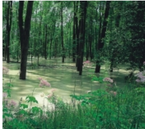
Mit den Überflutungen werden viele Nährstoffe in die Auen eingetragen. Durch diese natürliche Düngung zählen die Wälder der Hartholzauen mit zu den produktivsten und artenreichsten Pflanzengesellschaften Mitteleuropas.

Flüsse und ihre naturnahen Auwälder stellen wichtige Lebensadern dar, die die Landschaften durchziehen. Samen, Früchte und Pflanzenteile werden bei Hochwasser flussabwärts transportiert; Tiere schwimmen oder driften auf Treibholz den Fluss hinab. So trägt der Fluss zu einem ständigen genetischen Austausch bei.