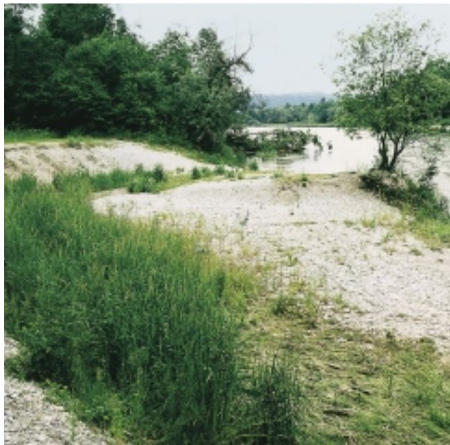
Durch den Abbau von Uferbefestigungen werden bisher vom Fluss abgeschnittene Altwasser bei Hochwasser wieder überflutet (Isar bei Wolfratshausen)

Rahmen des integrierten Rheinprogrammes von Baden-Württemberg wird dem Rhein in den Auwäldern zwischen Basel und Mannheim mehr Überflutungsraum verschafft. Auch in Bayern werden jedes Jahr erhebliche Mittel aufgewandt, um Land entlang von Flüssen und Bächen aufzukaufen und dort wieder ehemalige Überschwemmungsräume zurückzugewinnen.