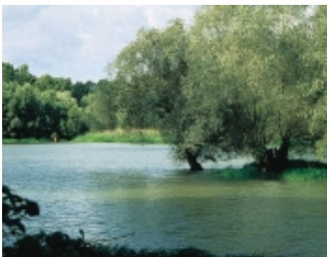
Das Leben im Wasser macht den Silberweiden nichts aus: Bis zu 200 Tage im Jahr können sie – wie hier an der Rheinaue – unbeschadet im Wasser stehen.

Sind die niedrigsten Uferbänke eines Flusses und die Ränder der Altwasser (=Geländebereiche, die bei niedrigem Wasserstand vom Fluss abgeschnitten sind) bis zu 190 Tage im Jahr überflutet, dann handelt es sich um typische Standorte der Weichholzaue . Auf den sandig-